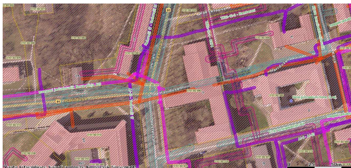
Skeem 2. Tehnovõrkude kaitsevööndid/isikliku kasutusõigusega alad tähistatud lilla, punase ja roosa värvitooniga.