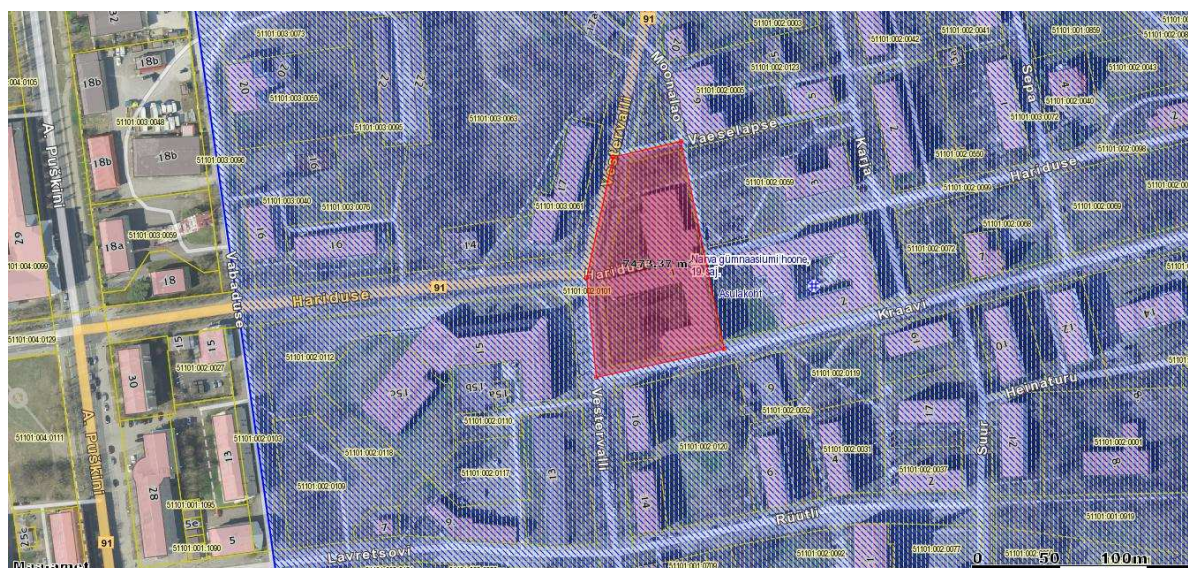
Skeem 1. Mälestiste ala (sinine ala) ja planeeringuala (punane ala).