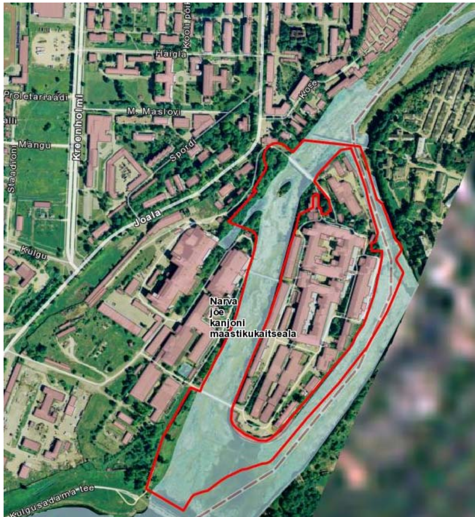
Joonis 1. jõe

Narva jõe kanjoni maastikukaitseala piirid on kinnitatud Vabariigi Valitsuse 13.05.1999. a määrusega nr 155 "Panga maastikukaitseala ja Narva jõe kanjoni maastikukaitseala kaitse-eeskirjade ja välispiiri kirjelduste kinnitamine". Maastikukaitseala piirid on toodud joonisel 1.