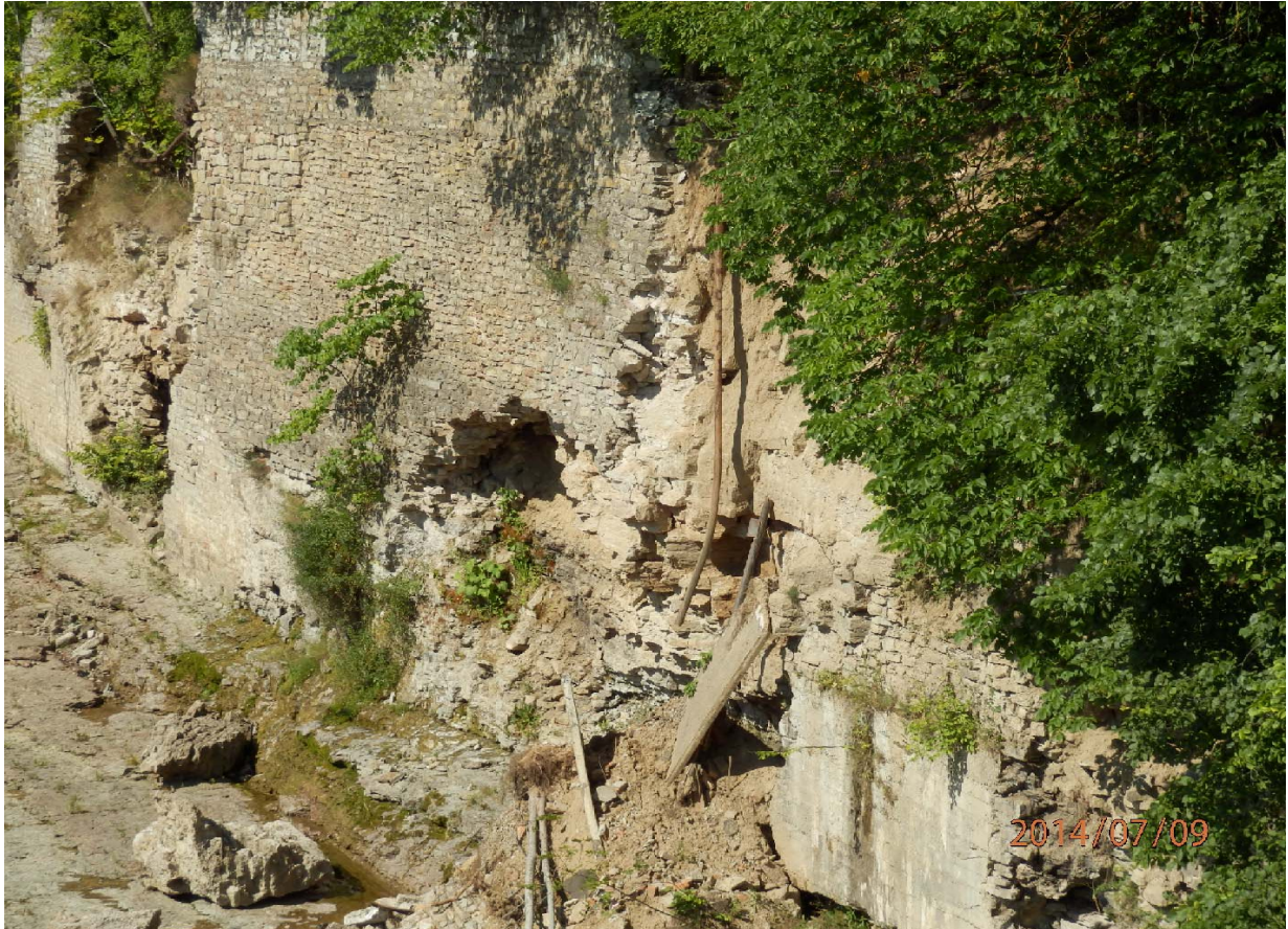
Joonis 4. Tugimüür 9. juulil 2014. a. Tugimüür on suures osas varisenud, säilinud müüriosa osaliselt pragunenud ja kohati on välja kukkunud kivid. On näha ka hiljutisi varinguid.