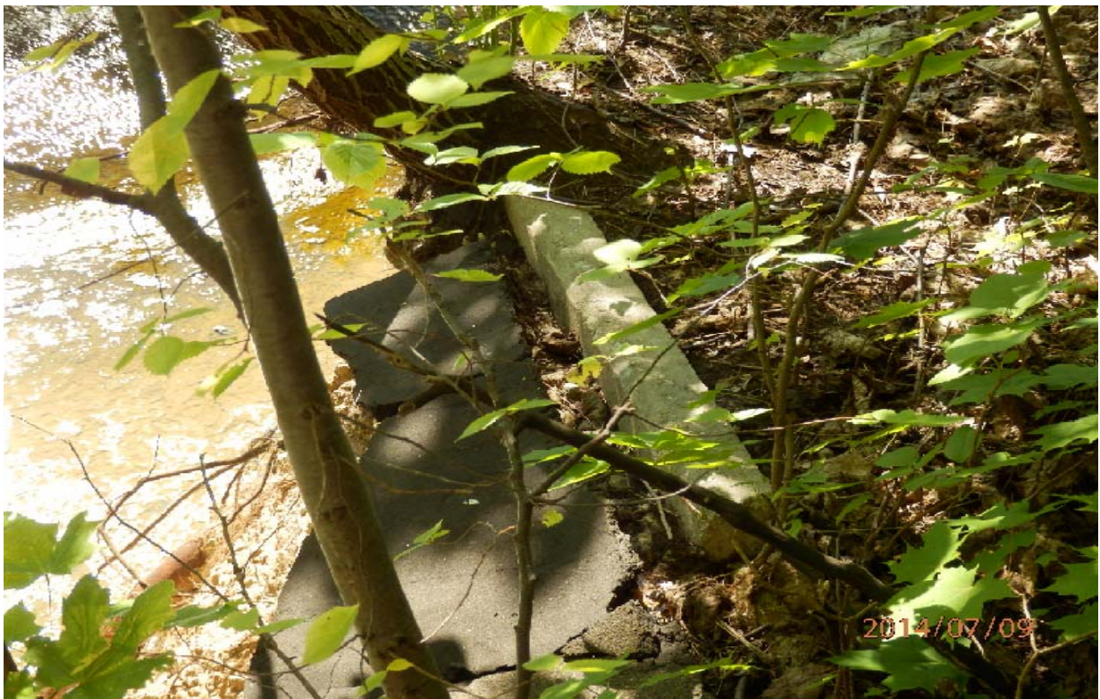
Joonis 5. Tugimüüri äär on jõkke varisenud, pildil müüri servas kulgenud asfaltkattega jalgteed ja äärekivi (konstruktsiooni on sisse kasvanud võsa).

Kanjoni nõlva tugimüüri seisundi ekspertiisi eesmärk, tööde loetelu ja tähtaeg