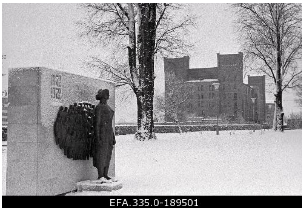
Joonis 3. Kreizbergi park Nõukogude ajal. Tagaplaanil on Narva jõe kanjoni nõlva tugimüür.